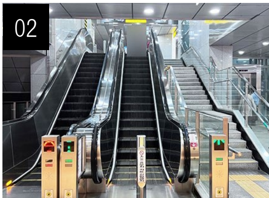
請使用手扶梯或電梯。