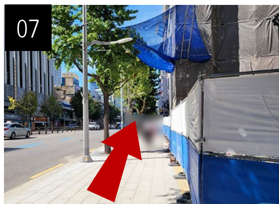
越過行人穿越道後左轉，然後往前直走約1分鐘。