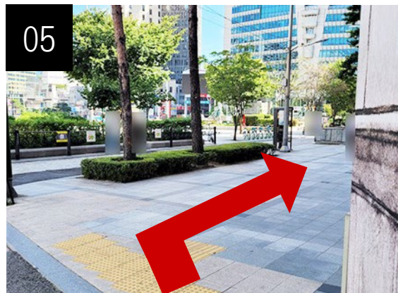
右轉朝行人穿越道走去。