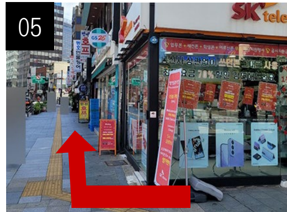
越過行人穿越道後，請沿著左側道路走。