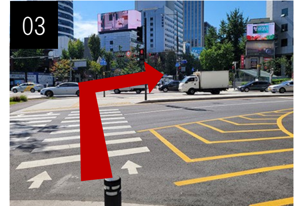
由手扶梯出站後，請越過左方的行人穿越道。(連續2次)