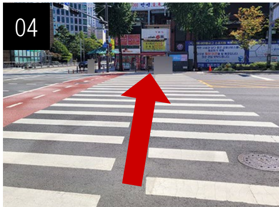
越過大馬路的行人穿越道。