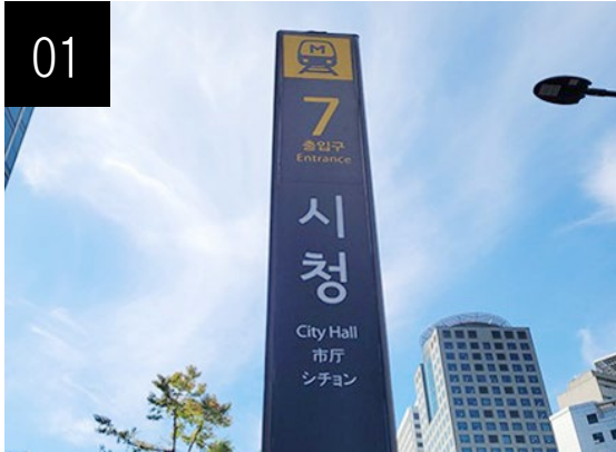
01 시청역 7번 출구로 나옵니다.