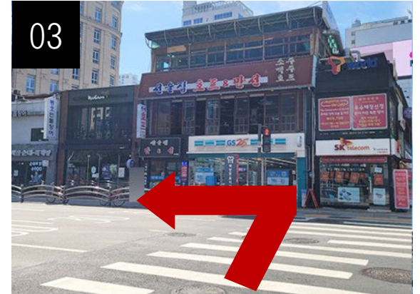
03 횡단보도를 건넌 후 왼쪽으로 걸어오세요.