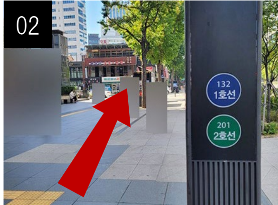
02 직진하면 바로 앞에 횡단보도가 보입니다.