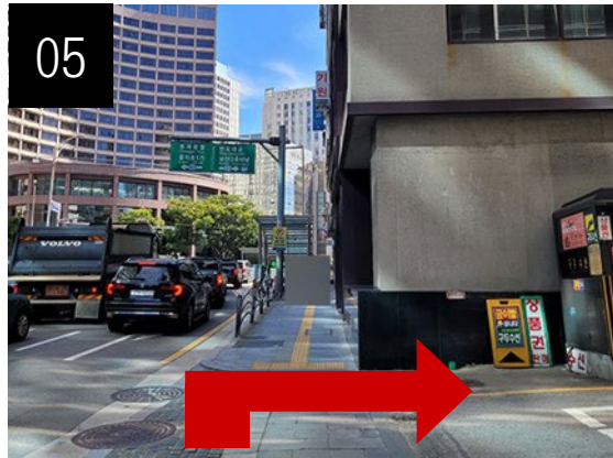
05 약 1분 정도 걸은 후 오른쪽 길로 들어오세요.