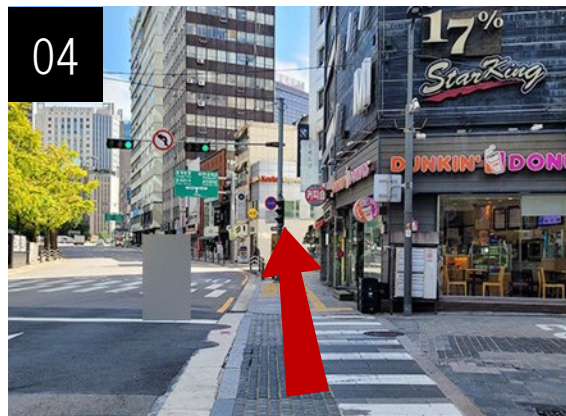
04 계속 걸어오세요.