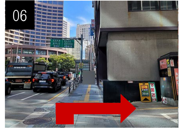
06 약 1분 정도 걸은 후 오른쪽 길로 들어오세요.