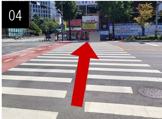
04 큰 대로의 횡단보도를 건너세요.