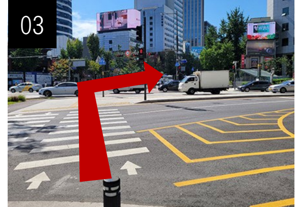
03 에스컬레이터에서 나온 후 왼쪽 방향의 횡단보도를 건너세요.(2회연속)