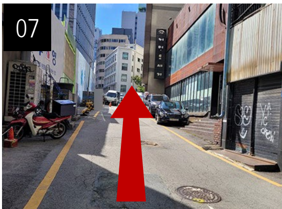
07 약 3분 정도 오르막길을 따라 걸어 올라오세요.