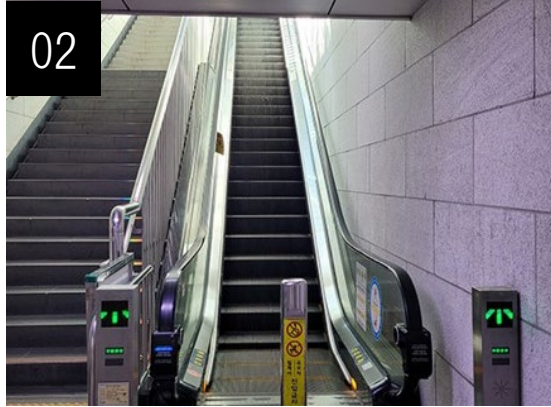
02 에스컬레이터를 이용하세요.