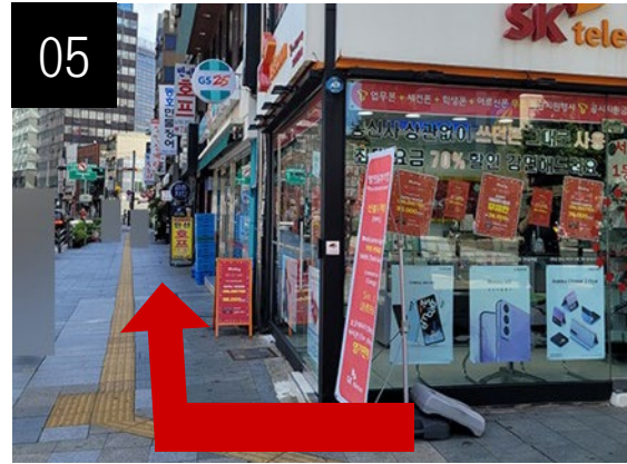
05 횡단보도를 건너 후 왼쪽 길을 따라 걸어 오세요.