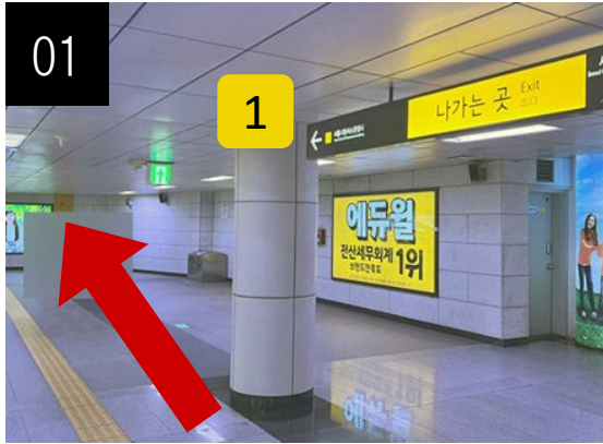
01 시청역 1번 출구로 갑니다.