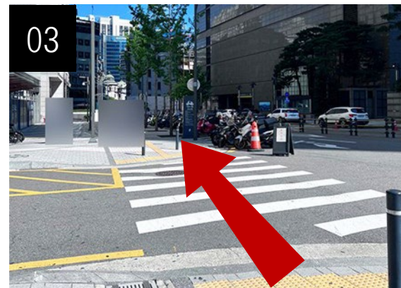
03 出てから直進します。