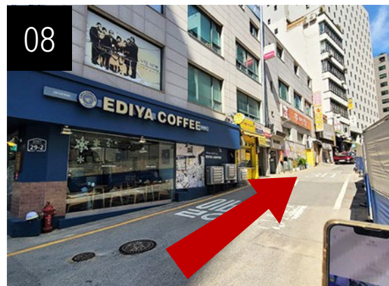
08 「EDIYA COFFEE」の路地に入ると、その先に相鉄ホテルズザ・スプラジールソウル明洞があります。