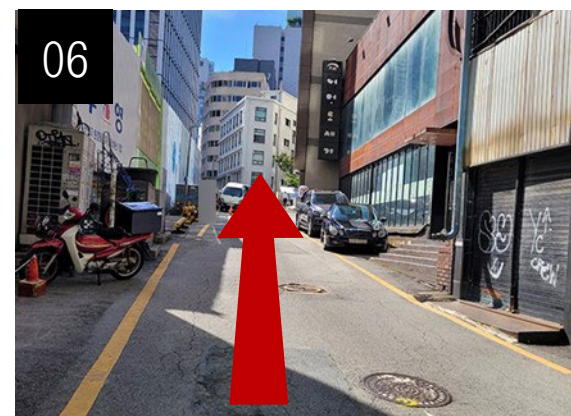
約3分、上り坂に沿って直進します。