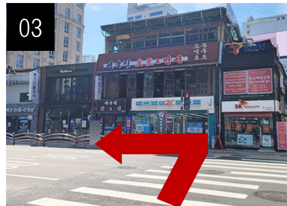
横断歩道を渡った後、左折します。