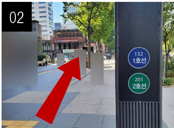
直進すると横断歩道が見えます。