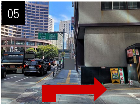
約1分歩いた後、右折します。