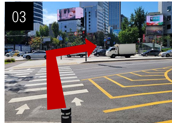
エスカレーターから出た後、左方向の横断歩道を渡ってください。(2回連続)