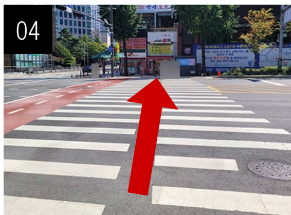
大通りの横断歩道を渡ります。