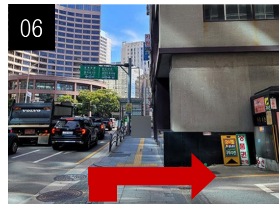
約1分歩いた後、右折します。