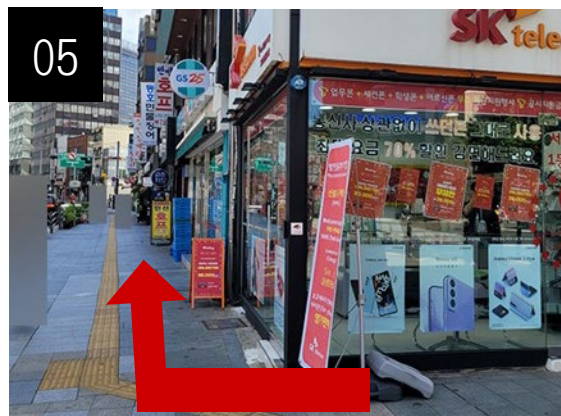
横断歩道を渡った後、左側の道に沿って歩いてください。