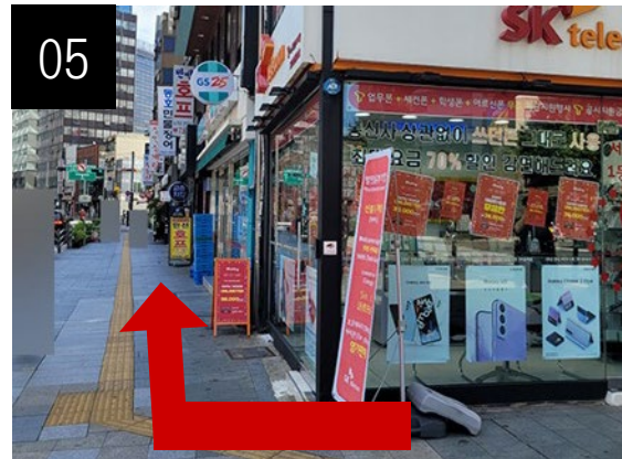
05 穿过人行横道线后请沿左侧道路步行。