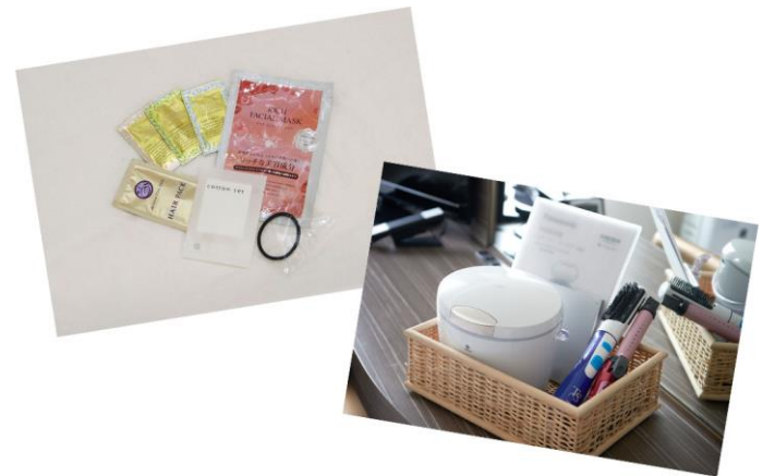
女性用アメニティ・貸出用備品 ※画像はイメージです