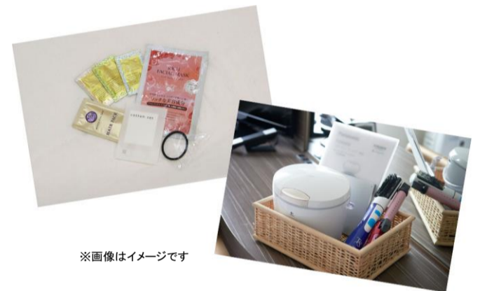
※画像はイメージです