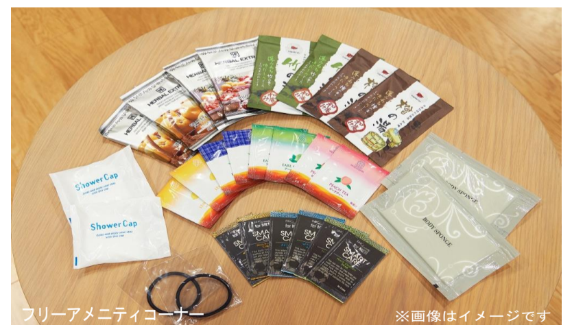
フリーアメニティコーナー