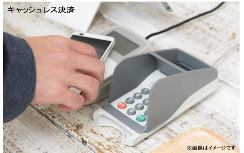
キャッシュレス決済