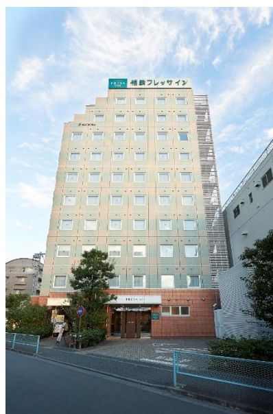
既存の「相鉄フレッサイン 鎌倉大船」(外観)