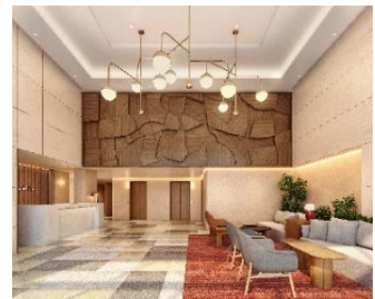
ホテルロビー（イメージ）